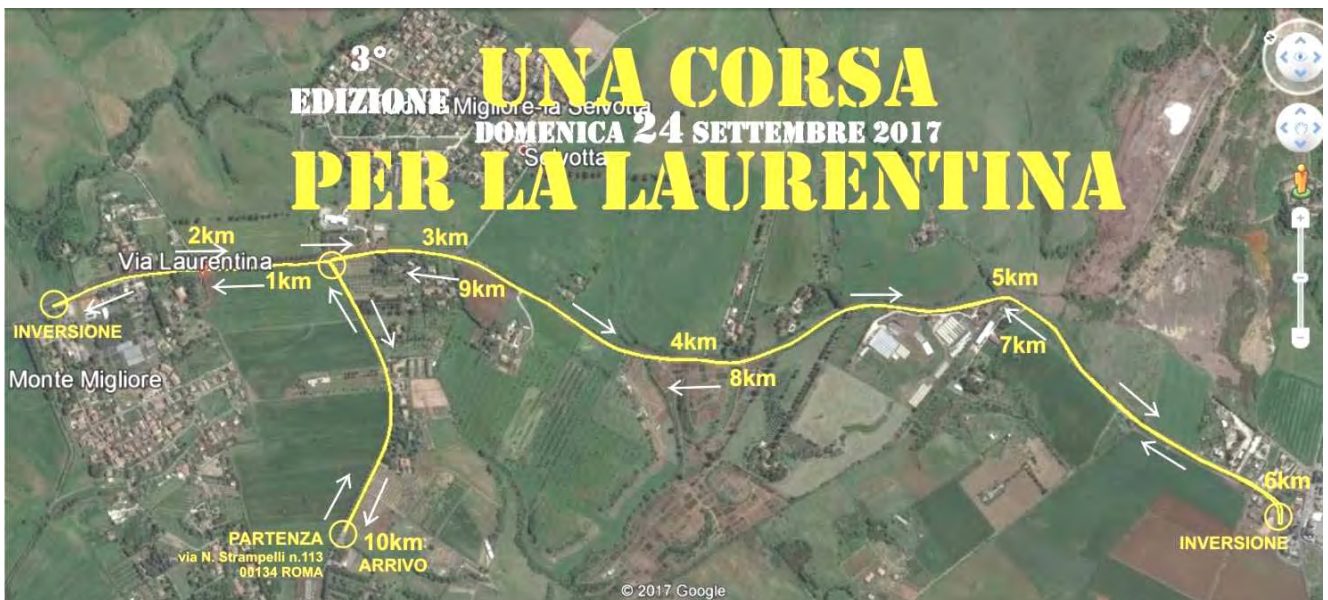
TRACCIATO DELLA CORSA